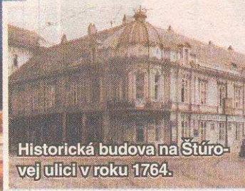
Historická budova na Štúrovej ulici v roku 1764.